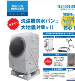
意外な家電の災害対策