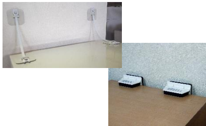
取付簡単！家具の転倒対策