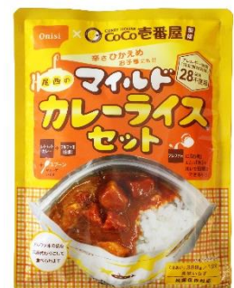
進化し続ける長期保存食