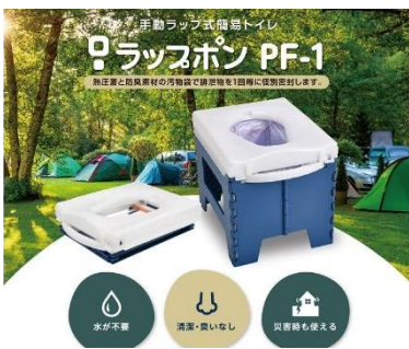
なくてはならない排泄対策