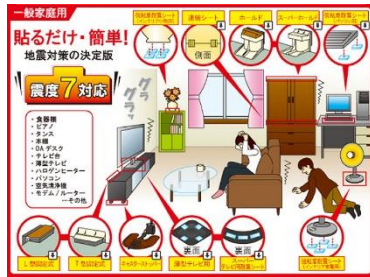
室内は実はキケンだらけ