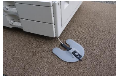
オフィス器具の対策も