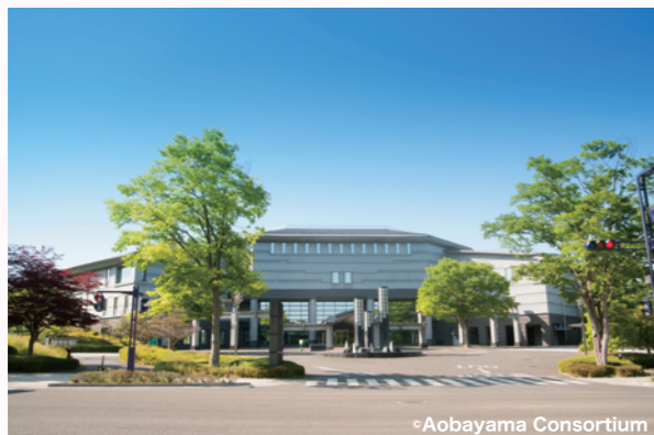
Aobayama Consortium 仙台国際センター