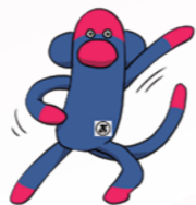
公式マスコットキャラクター おのくん