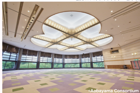
Aobayama Consortium World Bosai EXPO会場